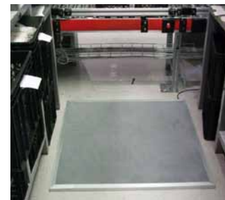
Finishing in grey smooth PVC