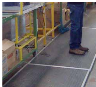
Finishing in black bubbled PVC