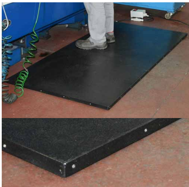
Finitura in acciaio verniciato al quarzo Quartz painted steel finishing