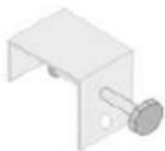
Tvirtinimui po parasoliais